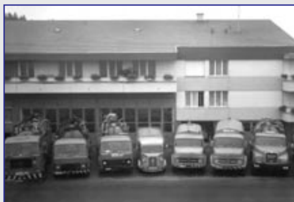
Von Uhwiesen nach Henggart

lung ganzer Dörfer an bei der Verlegung der Telefonleitungen.