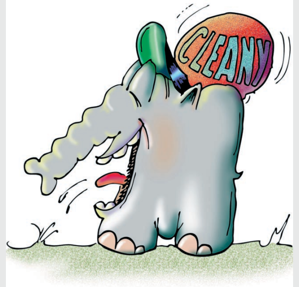
„De Cleany meint...“