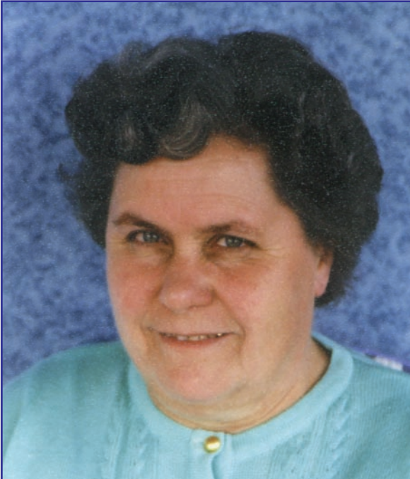
Die Frau dahinter: Familie und Geschäft zusammen gehalten...