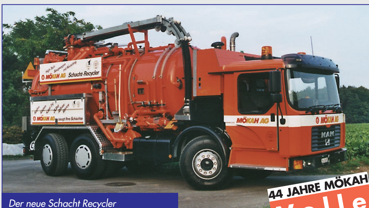
Der neue Schacht Recycler